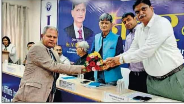
आईटीएम में इन्स्टीट्यूशन ऑफ इंजीनियर्स के राष्ट्रीय अध्यक्ष का स्वागत किया गया।